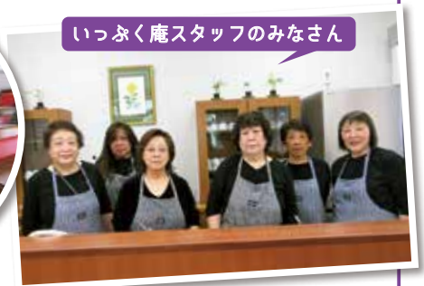
いっぶく庵スタッフのみなさん